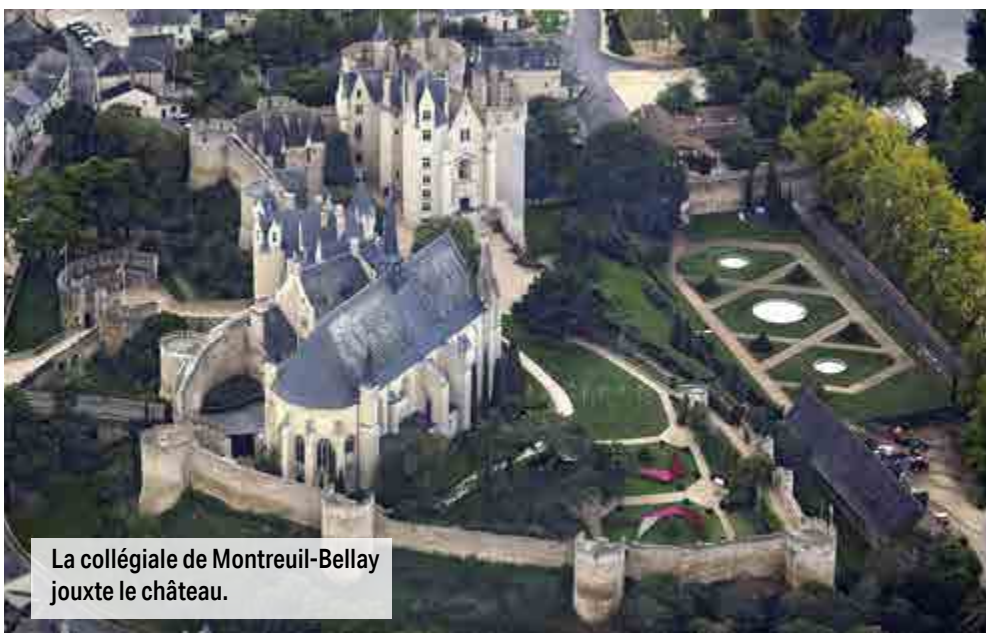
La collégiale de Montreuil-Bellay jouxte le château.