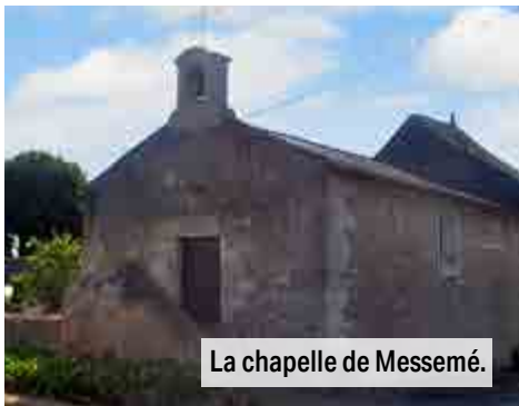
La chapelle de Messemé.