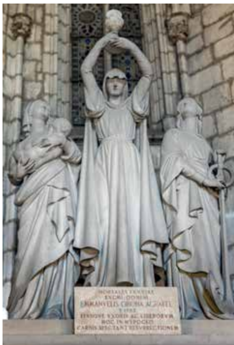
Un groupe statuaire de la cathédrale de Barcelone.

- La prudence est la disposition qui permet de délibérer sur ce qui est bon ou mauvais pour l'homme dans telle ou telle situation et d'agir en conséquence comme il convient. C'est en ce sens que la prudence conditionne toutes les autres vertus. - Ensuite vient la tempérance . Elle est la modération des désirs. C'est en quelque sorte un goût éclairé qui nous permet de rester maîtres de nos plaisirs au lieu d'en être les esclaves.