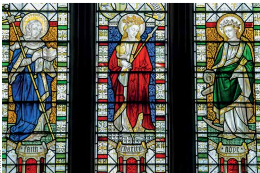
Un vitrail anglais.