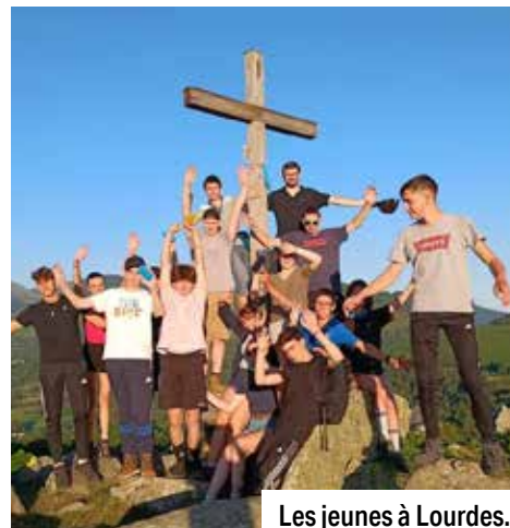
Les jeunes à Lourdes.