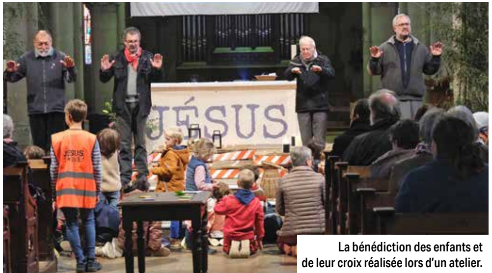
La bénédiction des enfants et de leur croix réalisée lors d'un atelier.

et de réflexion avec le partage des "5 essentiels", les 5 dynamiques de croissance pour développer la vie chrétienne en soi et au sein de sa communauté.