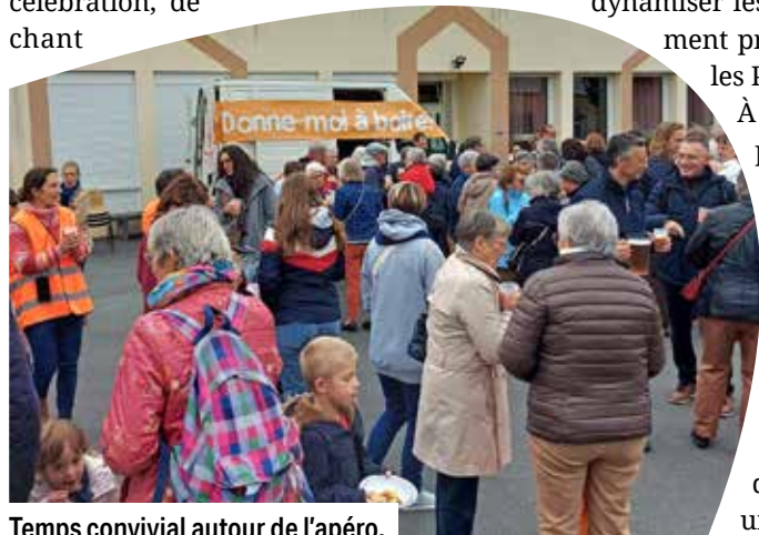
Temps convivial autour de l'apéro.

Le samedi s'adressait en particulier aux paroissiens avec des temps de prière, de célébration, de chant